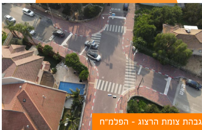
הגבתה צומת הרצוג - הפלמ"ח