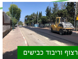
קרצוף וריבוד כבישים