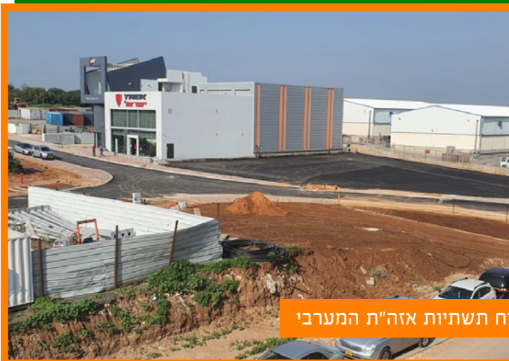
פיתוח תשתיות אזה"ת המערבי

תוכנית המתאר במהלך השנה, התוכנית עודכנה על ידי מנהל התכנון. במהלך שנת 2021 התוכנית תופקד שוב ואנו נלמד אותה ונשתף את הציבור.