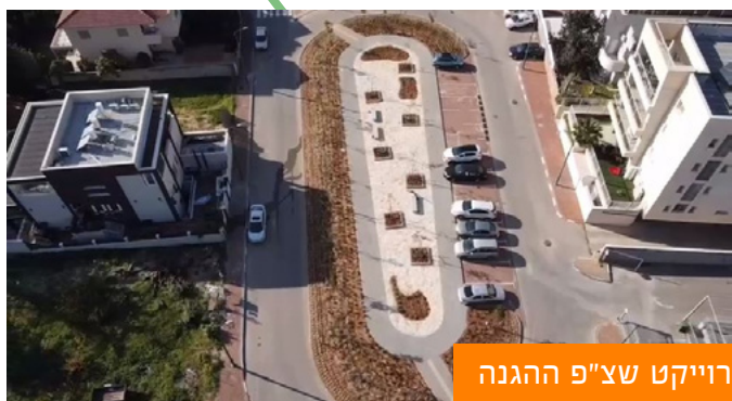
פרויקט שצ"פ ההגנה