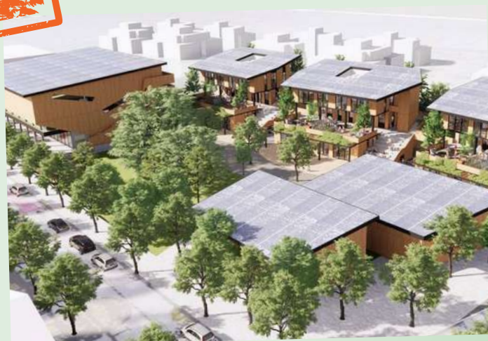
הדמיה בית ספר יסודי ברוח המונטסורי נוף השדות אדריכל - יואל דבוריינסקי | ליואי דבוריינסקי אדריכלים

✓ הפקת "צעדת הבלוטים", בעזרת המתנ"ס, בהשתתפות בתי הספר היסודיים.